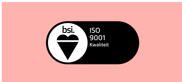
Lichte achtergrond: primaire Certificatielogo