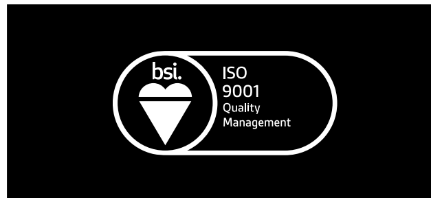
Zwarte achtergrond: secundaire Certificatielogo