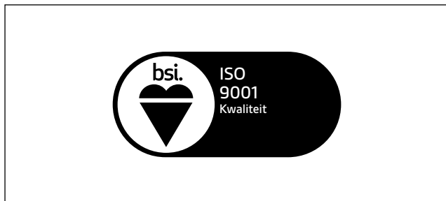
Witte achtergrond: primaire Certificatielogo