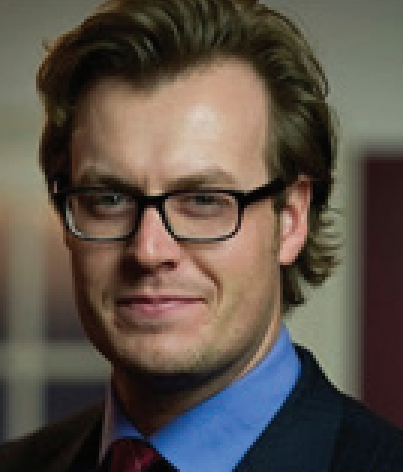
Rogier van Kuijk Nederlandse Spoorwegen