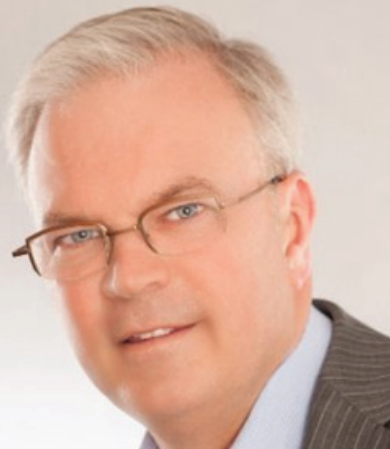
Leendert Dekker Tebodin Netherlands B.V.