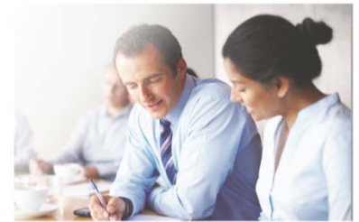
BSI PAS 7000 Capacity Building Program